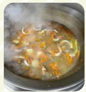
野菜の皮や端材を使用した手作りコンソメスープ