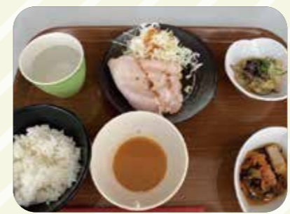
職員食堂で提供した焼豚定食

西宮渡辺病院栄養科では1日約720食の給食を、厨房内で全て調理・盛り付け・配膳しております。調理作業の効率化を目指し、昨年6月から西宮渡辺病院と西宮渡辺心臓脳・血管センターとの献立を完全統一化、12月からセントラルキッチン方式・クックチルシステムの試用を開始しました。今年本格稼働に向け、法人栄養科全体で協力し、持続可能な体制作りを目指します。またコスト削減と美味しさの両立を目標に、調理師と協力して新たに低温真空調理法を用いた調理に挑戦し、加工食品の使用量減少に取り組んでいます。また食品ロス削減のため、本来破棄する野菜の皮や端材を利用した出汁の抽出、残食量の削減に向けた取り組みを行っています。