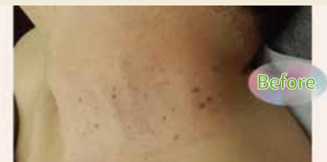
イボ除去【小腫瘍除去】