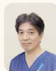
岸本 裕充 兵庫医科大学 主任教授

今後も地域拠点病院の歯科口腔外科として、診療の質および数のさらなる充実を図ってまいります。