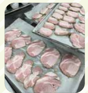
低温真空調理した焼豚