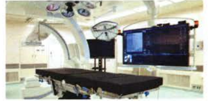
多目的型ハイブリッド手術室

猛暑の候、皆様におかれましてはますますご清祥のこととお慶び申し上げます。 この度、1階フロア改修工事が完了し、2管球スライス型CT・アンギオ装置・多目的型ハイブリッド手術室導入の運びとなりました。世界初2管球スライス型CTは、日本で3台目の導入となります。 これもひとえに皆様方の日頃からのご支援の賜物と深く感謝いたしております。 つきましては、下記のとおり内覧会を開催致したく存じます。 ご多用中誠に恐縮とは存じますが、なにとぞ万障お繰り合わせの上ご臨席賜りますようご案内申し上げます。