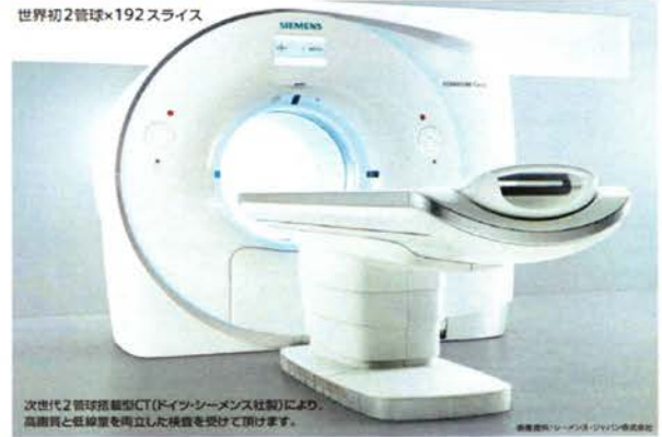
次世代2管球搭載型CT(ドイツ・シーメンス社製)により、高解像と低線量を両立した検査を受けて頂けます。